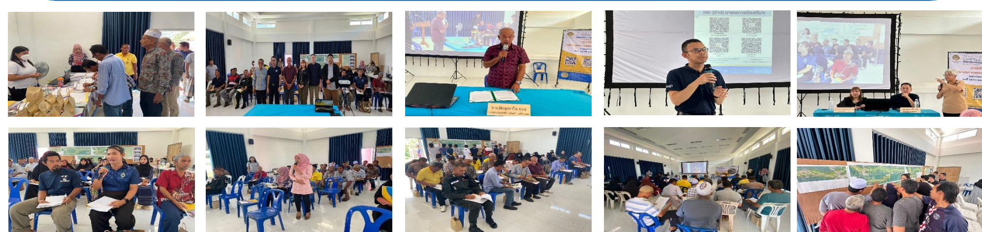
กลุ่มที่ 1 : วันอังคารที่ 14 พฤษภาคม 2567 เวลา 08.30 - 12.00 น. ณ หอประชุมศูนย์พัฒนาเด็กเล็กตำบลบ้านแหร์ ตำบลบ้านแหร์ อำเภอธารโต จังหวัดยะลา